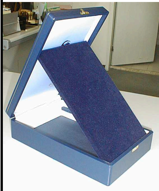
DETALHE DA CAIXA GRÃ-CRUZ