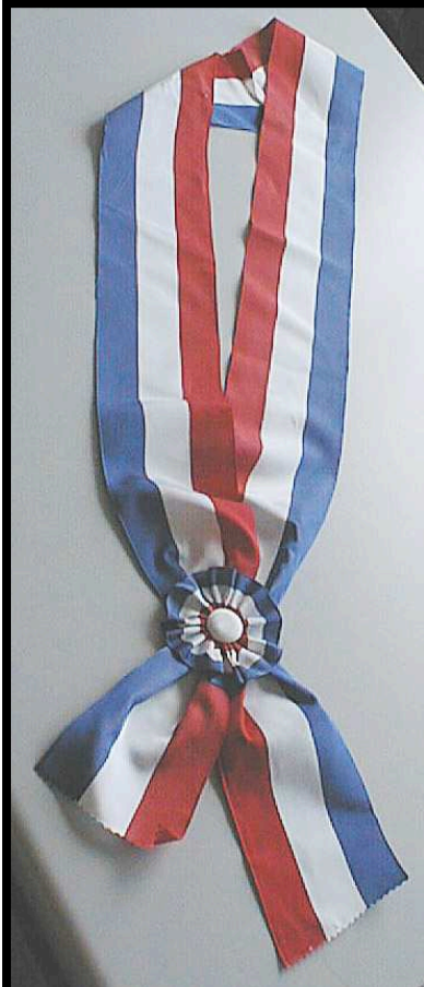
DETALHE DA FAIXA GRÃ-CRUZ