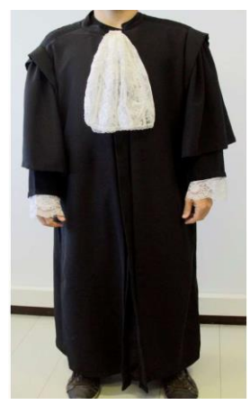
2- MODELO TOGA DIÁRIA PROCURADOR/DESEMBARGADOR/ JUIZ CONVOCADO