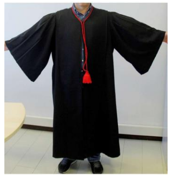
3- MODELO VESTE ADVOGADO