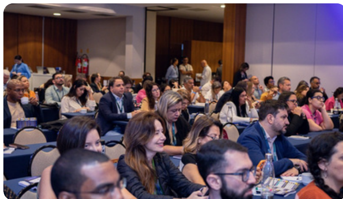
Equipe Grupo CLG