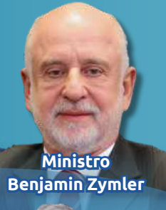
Ministro Benjamin Zymler